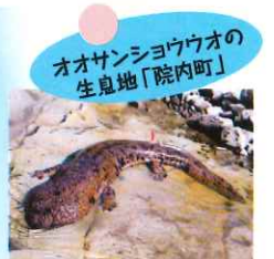
オオサンショウウオの生息地「院内町」

まごころのこもった特産品や、山の幸をつかったレストラン。ここから、院内のホットな情報を発信します。