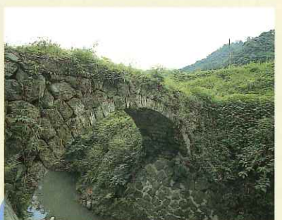
西光寺橋 Saikoji Bridge (市指定有形文化財) この橋は、江戸時代末に建立された西光寺(現在は廃寺)の参道として使われてきました。側壁は、自然石を使用しています。