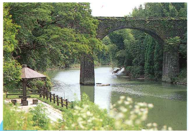
御沓橋 Mikutsu Bridge (県指定有形文化財) 橋の長さが59mと、院内町最長を誇る3連アーチ橋。大正14年に架設されたこの橋は、当時のモダンなセンスが活かされています。川面に映しだされた姿も幻想的。(夜間ライトアップ)