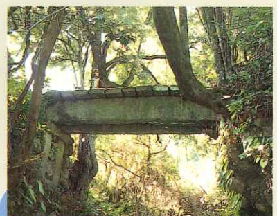
久地橋 Kyuchi Bridge (市指定有形文化財) 両端を大桁の石2本で渡し、厚さ15cmの重厚な板石が16枚も並べられた、県下でも珍しい桁橋です。右岸は桁石を支えるため石組みが施されています。