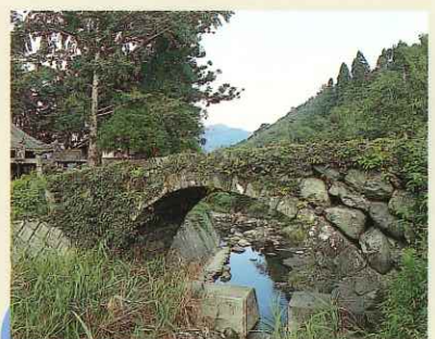
一の橋 Ichino Bridge (市指定有形文化財) 山神社への参道で、北山川に架かる石橋です。規模は小さいながら側壁に自然石を使用した整った姿は、緑豊かな周囲の景観になじんでいます。