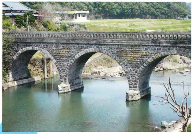
分寺橋 Buji Bridge (市指定有形文化財) 当初、大正時代に架設されましたが、昭和20年に大改修がされた3連のアーチ橋です。戦争真っ最中の改修にも関わらず、均整に彫刻された石がていねいに積み上げられています。