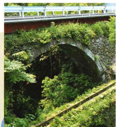
打上橋 Uchiagari Bridge (市指定有形文化財) 現存する院内の石橋のなかで最も古い、江戸時代末の文久3年に架設された石橋。橋の下には、打上水路橋が架けられています。