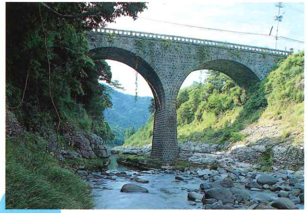
荒瀬橋 Arase Bridge (市指定有形文化財) 完成後しばらくの間は有料とされ、県下では第一号の有料橋でした。長い橋脚と美しい2連アーチを描く石橋で、橋高は18.3mと院内町最高の高さを誇っています。(夜間ライトアップ)