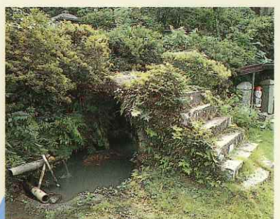
福厳寺羅漢橋 Fukugonji-rakan Bridge 十王像や羅漢像、牛頭・馬頭像、観音像などが安置された福厳寺閻魔洞(市指定史跡)へつながる参道にかけられた石橋です。