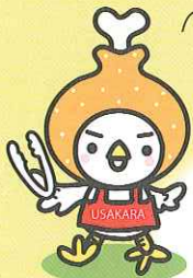
うさからくん